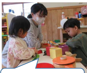
ままごと楽しいね！