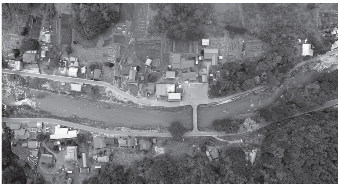
水道施設の整備が待たれる安家地区

で、1件当たりの平均事業費は217万円であった。他の1件は、河川と道路の横断工事が必要な特別な工事であったことから、事業費が380万円と多額だったが、特別な工事を除いた額は173万円である。台風10号により被災した飲料水個人施設の復旧も別途補助金交付要綱を制定し支援している。本要綱も事業費200万円を上限に9割を補助している。事業の実績は、29年度が15件で平均事業費118万円。30年度は、13件で平均事業費162万円である。両事業とも補助金交付要綱の基準上限額と大差なく完了しているため、今後も現行の補助制度を継続していく。特殊なケースの場合には、利用者に寄り添い、専門的な技術指導や事業費の軽減化に向けた助言などを積極的に行う。