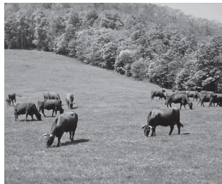
素晴らしい環境で育つ いわいずみ短角牛

町長 ミート工房を再建できないでいる理由は、牛肉の販売対策が非常に厳しく、施設を所有、経営していた(株)岩泉産業開発が、断念