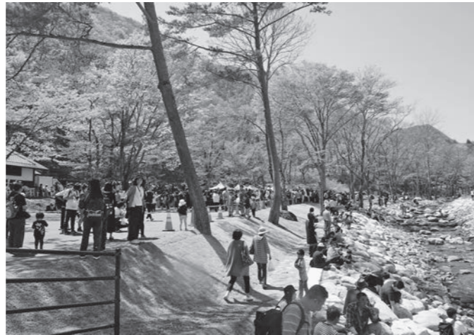
連休中多くの観光客でにぎわった龍泉洞

問 4月から5月の10連休は、観光や集客にとって、またとないチャンスだった。本年度の龍泉洞入洞者数20万人の目標達成は可能か。