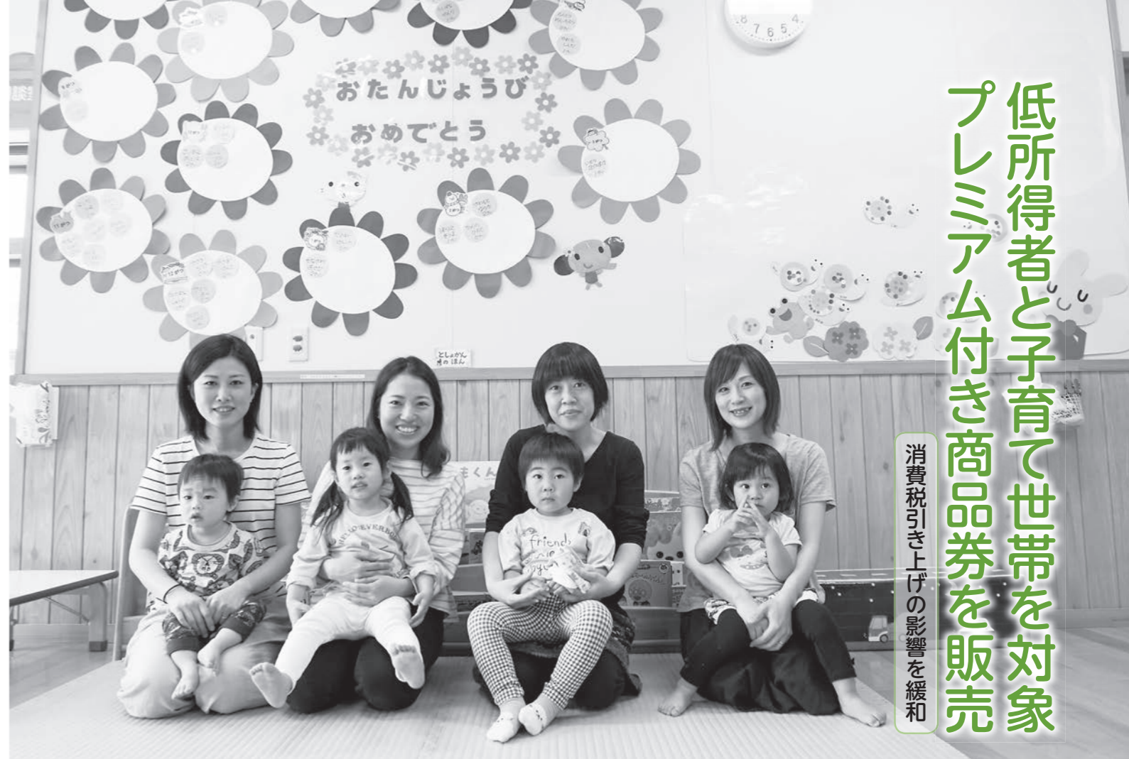
消費税引き上げの影響を緩和