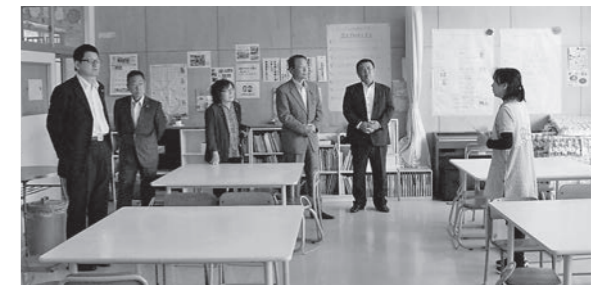
いわいずみ放課後児童クラブの現状を聴く

5月23日、いわいずみ放課後児童クラブと小川放課後児童クラブの現状を調査しました。 いわいずみ放課後児童クラブでは、支援員から概要や現状の説明を受け、1年生の利用状況を視察しました。 小川放課後児童クラブは、本年度からスタートしています。利用児童の様子を見学しました。