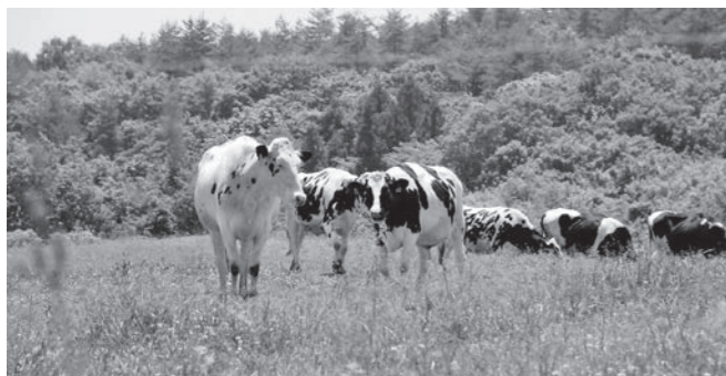
酪農振興にも水は不可欠

答 整備当時の状況から比べると、営農している件数、家畜の数は減少傾向である。それらを考慮すると現状の水量で十分足りる。