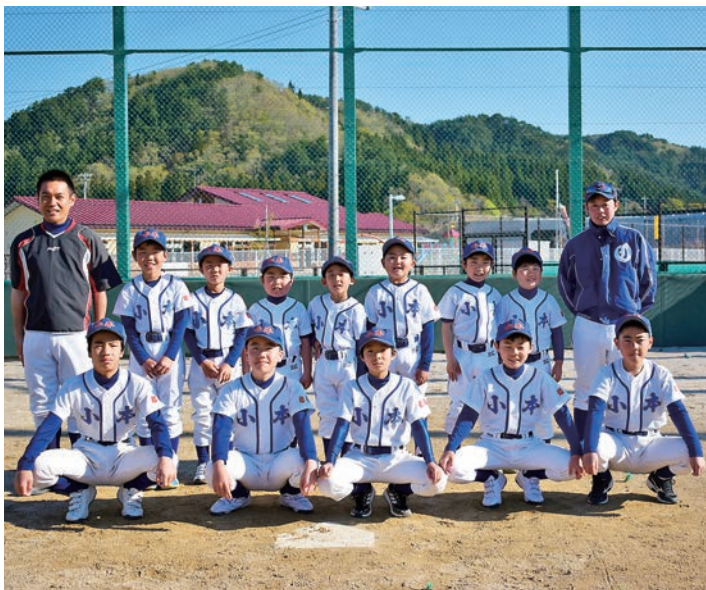
小本野球スポーツ少年団

8月12日(月)に、楽天イーグルス岩泉球場でプロ野球イースタン・リーグ公式戦「楽天対巨人」が開催されることが決定し、野球に一生懸命取り組んでいる子どもたちの声を聴いてきました。