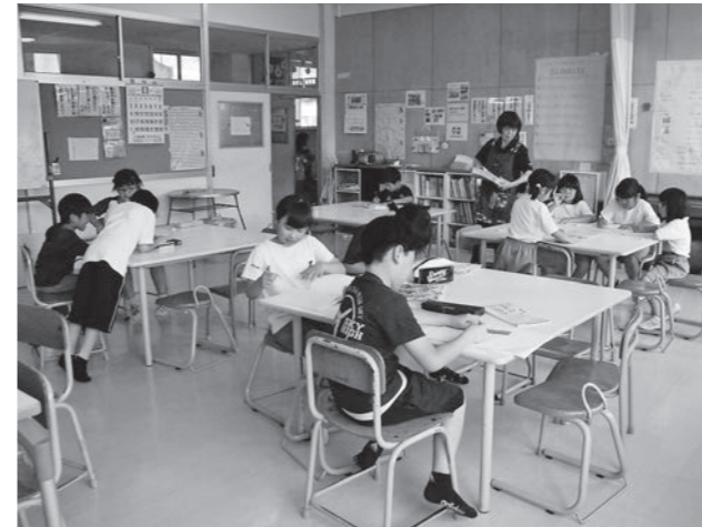
まずは宿題を 放課後児童クラブ

教育長 スポーツ少年団体験入団の働きかけや岩泉スポーツクラブによる出前講座の情報提供などが考えられる。関係者と整理すべきことがあることから、研究・検討をしていく。