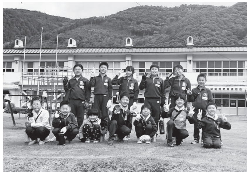
惜しまれながら本年度で閉校になる小川小学校

町長 児童数の減少に伴い「学校適正配置基本計画」に基づき学校統合を進めている。来春、閉校予定である小川小学校校舎の利活用は、提言のあった多目的交流施設としての活用も含め、地域の