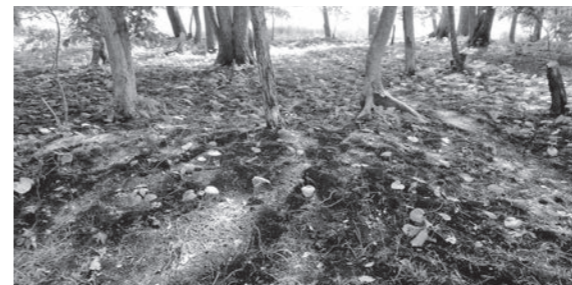
林間でのワサビ栽培

5月22日、大牛内地区のワサビ栽培と二升石地区での高性能林業機械の稼働状況を調査しました。 大牛内地区のワサビ栽培は、地形の特性上、平地で栽培ができる好条件でした。 高性能林業機械は、町の補助事業で整備したものの、女性オペレーターが操作し、効率よく仕事をしていました。